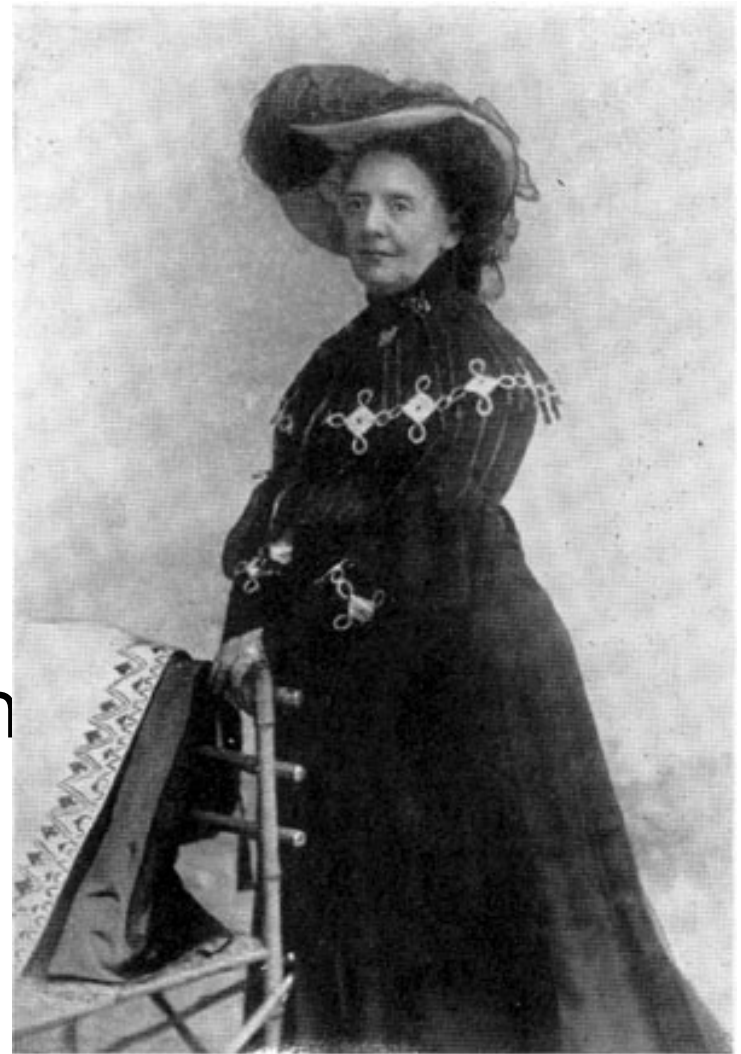
Fredrikke Marie Qvam. Fotografi.